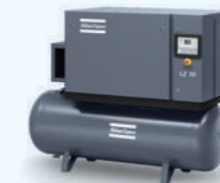
Montado sobre depósito: LZ 7/10