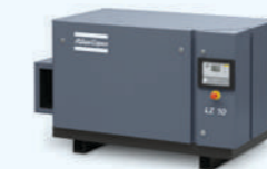
Montado sobre bancada: LZ 7/10 - LZ 15/20

**** Nivel sonoro medio, medido según el código de prueba ISO 2151/Pneurop/Cagi PN8NTC2; tolerancia 3 dB(A).