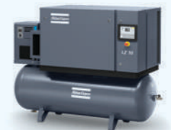
Full Feature: LZ 7/10