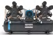
Montado sobre tanque 2 etapas/10 pistones 30 hp