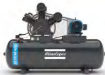
Montado sobre tanque 2 etapas/3 pistones 10 hp