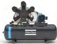
Montado sobre tanque 2 etapas/5 pistones 15 a 20 hp